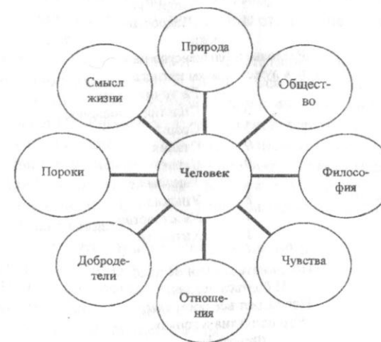
Структура произведения «Фауст» Гете

Какое количество цитат можно найти на каждую из этих тем? (см. схему 2).